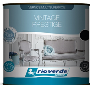
Finitura ad acqua Extra Opaca Vintage Prestige Shabby Rio Verde Renner