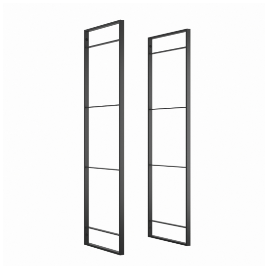
Emuca Struttura per Scaffale Lader, 1150, Verniciato nero, Acciaio