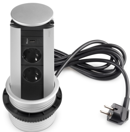
Emuca Multiconnettore Port USB, Anodizzato opaco, Tecnoplastica e Alluminio