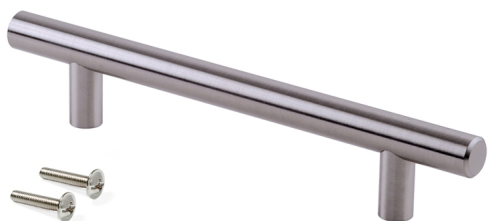
Emuca Maniglia per mobile Orlando, 320, Nichel satinado, Acciaio