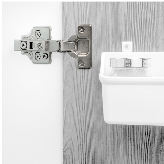
Emuca Kit cerniera a scodellino di collo alto X91 con chiusura ammortizzata e basetta