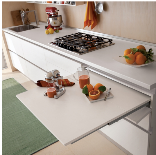
Emuca Guide per tavolo allungabile Cocktail Reverse H35, Champagne anodizzato,