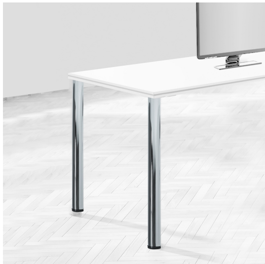
Emuca Gambe per tavola D. 60 mm di acciaio, Ø 60, Nichel satinado, Acciaio