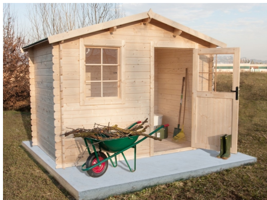
Casetta toronto cm. 300x200 - Casette in abete grezzo - Losa Esterni da vivere