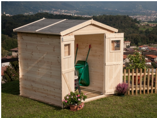
Casetta greta cm 200x250 - Casette in abete grezzo - ESTERNI DA VIVERE