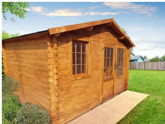
Casetta ines cm. 400x400 - Casette impregnate in autoclave - Losa Esterni da vivere