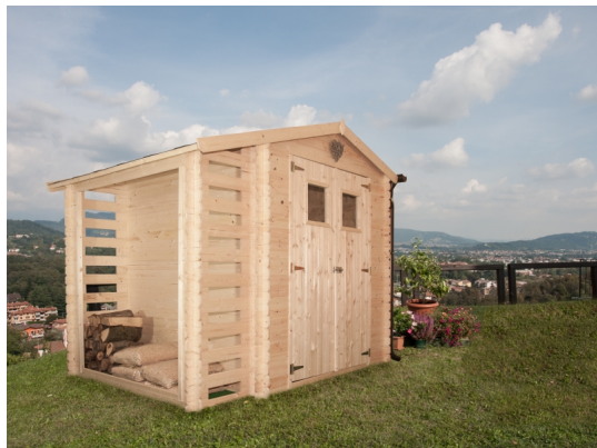
Casetta con legnaia ava cm. 200x200 - Casette in abete grezzo - Losa Esterni da