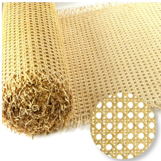
Paglia, di, vienna, rotolo, bricolegnostore