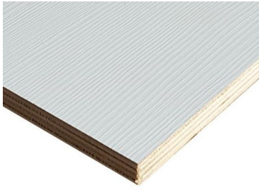
Multistrato, bilaminato, bianco, shining, oak, matrix, bricolegnostore3