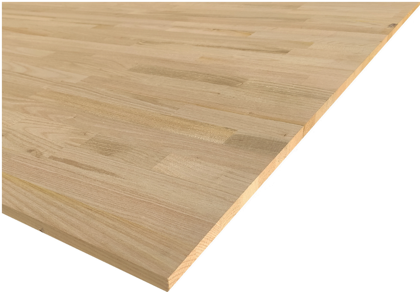
Pannello Lamellare Castagno