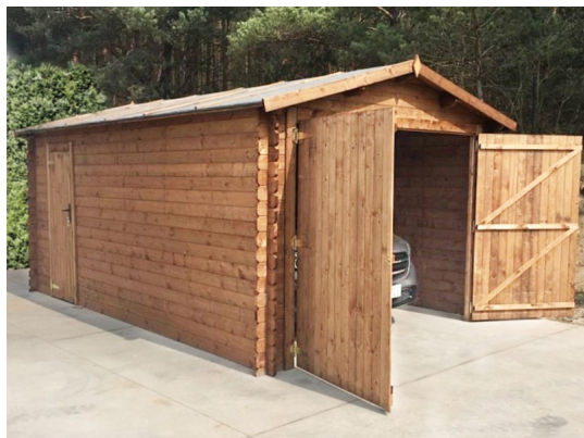
Garage cm. 350x600 - Casette impregnate in autoclave - Losa Esterni da vivere