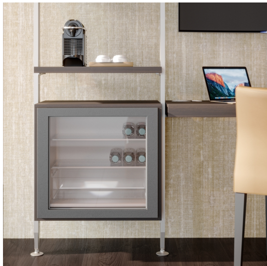
Emuca Kit Zero di supporti per mensole in legno, modulo e barra appendiabiti, Color