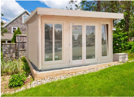
Casetta carla cm 408x268 - Casette in abete grezzo - Losa Esterni da vivere