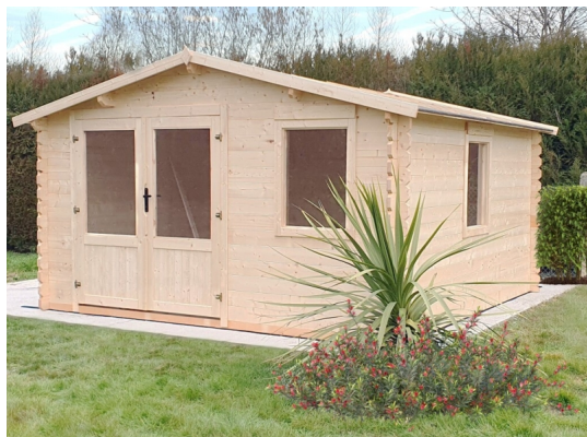
Casetta valencia cm 400x400 - Casette in abete grezzo - ESTERNI DA VIVERE