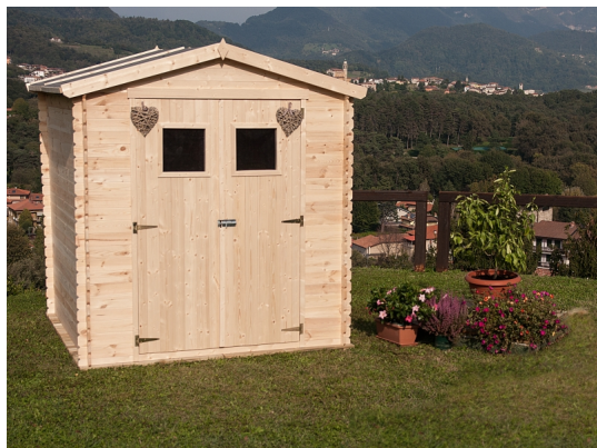
Casetta giulia cm. 200x200 - Casette in abete grezzo - Losa Esterni da vivere