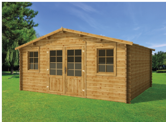
Casetta emma cm. 500x400 - Casette impregnate in autoclave - Losa Esterni da vivere