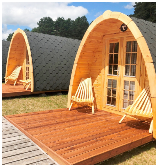
Camping pod cm. 300x600 - Camping pod - Losa Esterni da vivere